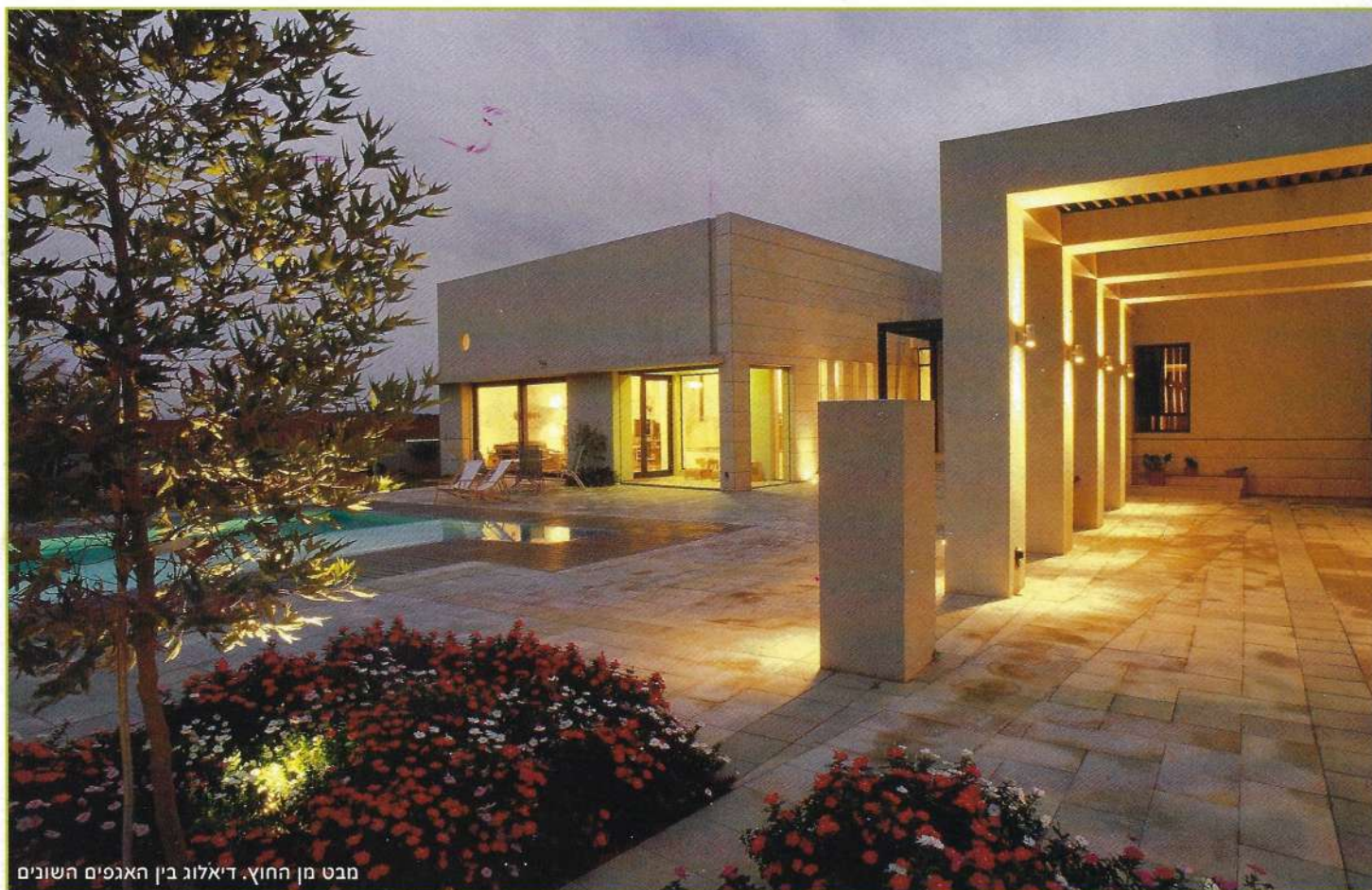
מבט מן החוץ. דיאלוג בין האגפים השונים

האגף השני, הציבורי, מעוגן היטב לאדמה. הוא מורכב משכבות אופקיות שחלקן שקועות וחלקן מוגבהות. שכבות אלה נמצאות בחלל קובייתי אשר נפתח אל החוץ באופן מדוד. האגף מדגיש את השכבתיות האופקית שלו על ידי השתקפותו בבריכה. שני האגפים יוצרים ביניהם דיאלוג צמוד, חיצוני