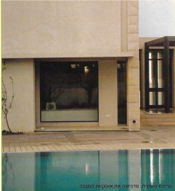
בריכת השחיה. מדגישה את אופקיות המבנה