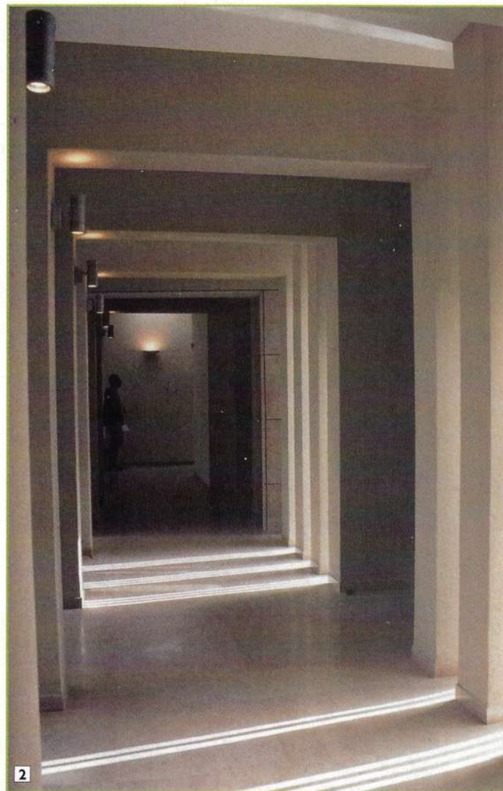
1. מבט לפינת האוכל ולחדר המגורים 2. מסדרון המקשר בין חללי הבית. דגש על תנועתיות ומקצב