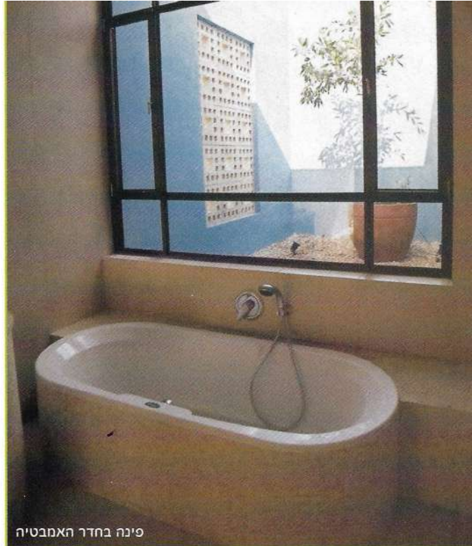
פינה בחדר האמבטיה

האגפים. תנועה מעניינת אחרת בבית נערכת בין שני האגפים, בעת החליכה מחדר השינה אל חלל המגורים, וממנו – אל אולם הקולנוע הביתי השקוע בחלקו באדמה. תנועה זו מלווה במקצב של מסגרות אור הנוצרות בין עמודים וקורות התוחמים את החלל. בדיוק כמו ■ טקס הליכה לקולנוע.